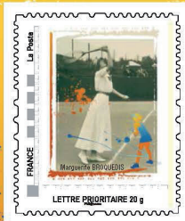
Marguerite BROQUEDIS Meilleure joueuse française en 1913 et 1914

Reconnue pour sa beauté et l'élégance de son jeu, Marguerite possédait un service puissant, un coup droit précis et une volée athlétique pour un jeu offensif. En 1912, elle représente la France aux JO de Stockholm, remporte le simple dame et se voit surnommer "La Déesse". Meilleure joueuse française en 1913 et 1914, Broquedis triomphe au Championnat de France, cette dernière année, face à une adolescente de 15 ans nommée Suzanne Lenglen. Après-guerre, Marguerite remportera encore de nombreux titres, notamment en double.