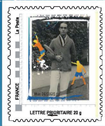
Max DECUGIS Premier français à remporter un titre étranger en 1901.

Max Decugis est souvent le premier. Premier grand champion français. Premier joueur tricolore à remporter le tournoi junior de Wimbledon en 1896 et 1897. Premier français à remporter un titre étranger en 1901. Il fait partie de la première équipe de France à disputer une rencontre de Coupe Davis en 1904. Obstiné et volontaire, Decugis possède dans son jeu des coups forts et précis. Avec 8 titres de champion de France en simple et 21 en double, Max Decugis possède un palmarès inégalable.