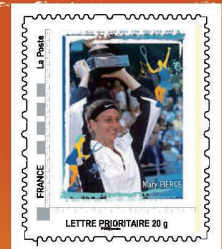
Mary PIERCE La dernière gagnante française à Roland-Garros.

Mary Pierce défendra les couleurs de la France et remportera la Fed Cup à deux reprises, en 1997 et 2003.