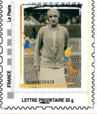
Suzanne LENGLEN Un palmarès inégalable de 1919 à 1926.

De 1919 à 1926, Lenglen établit un palmarès inégalable. Sa renommée fait bientôt d'elle une égérie dépassant le monde du tennis. Elle conseille les Mousquetaires, donne son nom à une raquette et participe à l'émancipation féminine.