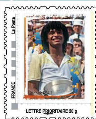
Yannick NOAH Dernier français à remporter Roland-Garros en 1983.

Suivant le conseil du champion, la FFT apporte tout son soutien au jeune Yannick Noah. Champion de France cadets, puis Juniors, n°1 français et vainqueur du National de 1979 à 1982, il devient n°3 mondial en 1986. En tant que capitaine, il amènera les équipes de France à la victoire en 1991 et 1996 pour la Coupe Davis, et en 1997 pour la Fed Cup.