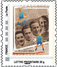
Jean Borotra, Jacques Brugnon, Henri Cochet et René Lacoste sont à jamais... "LES MOUSQUETAIRES".