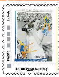
Françoise DÜRR Victorieuse à Roland-Garros en 1967.

Sur un plan technique, Françoise reste également célèbre pour sa prise de raquette atypique avec son poignet appuyé le long du manche.