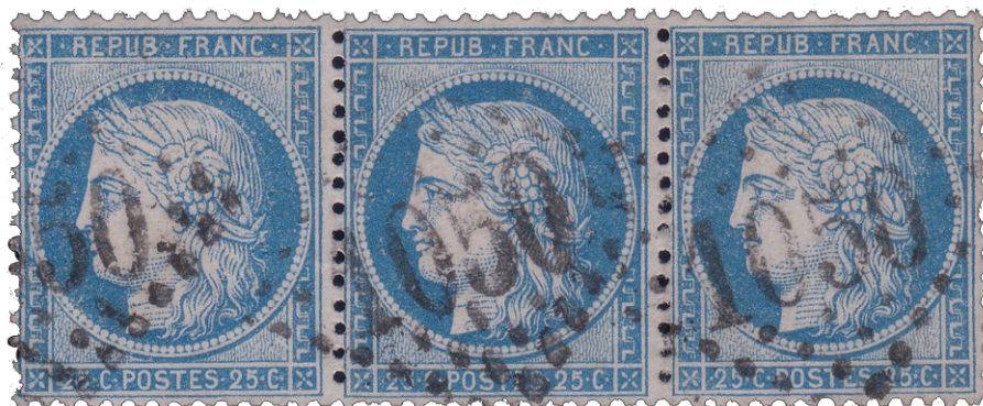
n° 60BB bande de 3, positions 111G5 112GR (type III) 113G5.

Pierre Germain : « Le 25 centimes Cérès de 1871 au type II » Imprimerie Alençonnaise, 1963 (1) Pierre Germain: Documents Philatéliques n°51, Académie de Philatélie, 1972 Capitaine de Vaisseau de la Mettrie : Etude n°235 du Monde des Philatélistes « Le 25 centimes Cérès de 1871 », 1979