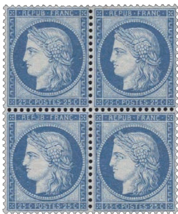
Bloc de 4 du n°60B de la planche 4