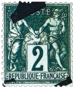
3 Collés avant l'impression du journal, c'est le texte qui annule le timbre, lui offrant une jolie plus-value.