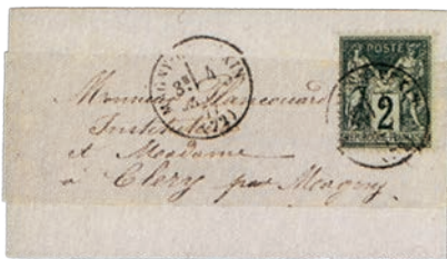
1 Souvent collés à cheval sur la bande et l'imprimé, les petits Sage ont fini en deux morceaux.