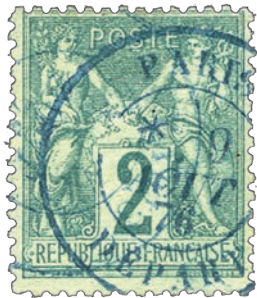
2 Les cachets à date à l'encre bleue sont rares.