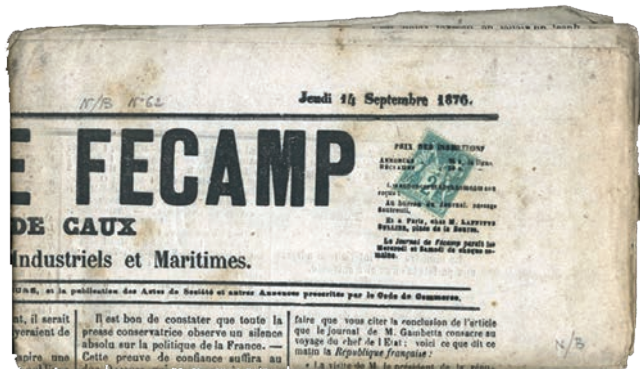
4 Un journal entier affranchi avec un petit Sage demeure difficile à trouver sur le marché.

Si la valeur faciale des petits Sage peut paraître ridicule, moins de 5 centimes, leur cote ne connaît pas toujours le même sort. La plupart des exemplaires sur le marché permettent de voguer sans se ruiner dans les belles vagues de nos classiques, mais quelques-uns ont de quoi faire rêver les collectionneurs ! Il faut donc regarder ces timbres, utilisés sur une très courte période et pour des emplois très ciblés, avec un œil avisé afin de ne pas passer à côté de la perle rare.