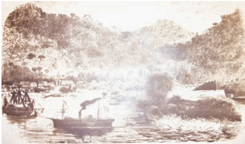
La baie d'Acapulco