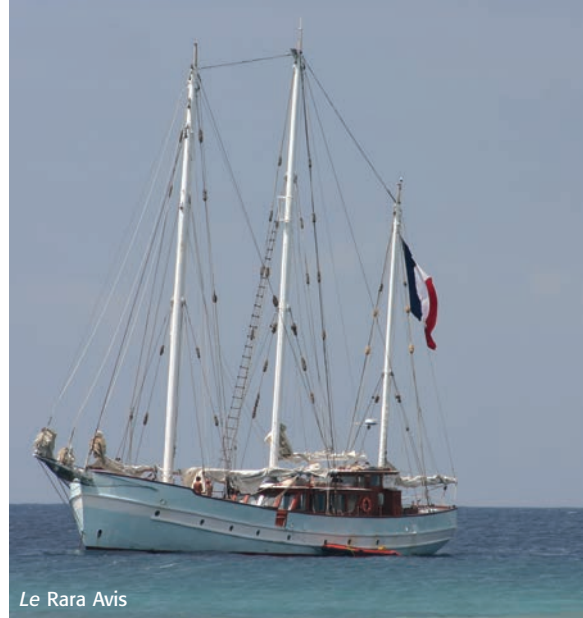
Le Rara Avis