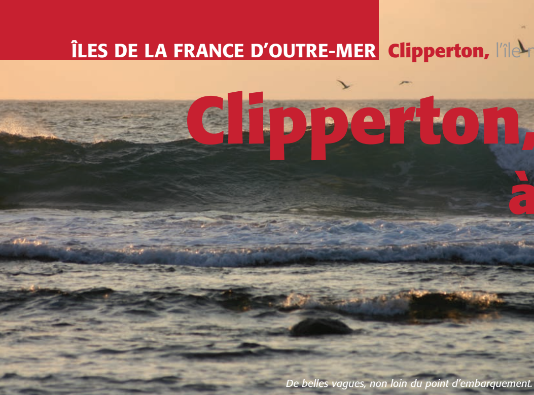
De belles vagues, non loin du point d'embarquement.

Après avoir évoqué les rares plis de cette île déserte et la thématique oiseaux, fin du reportage sur l'île de la Passion.