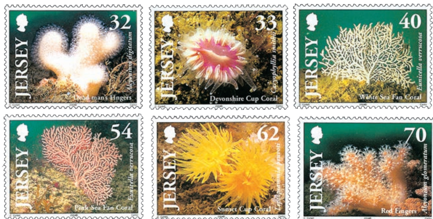
Les coraux, une thématique très visuelle qui ne manque pas d’attraits.

vite étourdissant et amplifié par un vent permanent qui ne désarme jamais. Clipperton, un atoll indomptable ? Il y a un peu de cela et les multiples épaves échouées sur la plage sont là pour l’évoquer de façon spectaculaire. Les tentatives des hommes pour y séjourner ont rarement été des réussites, à l’exception des expéditions naturalistes qui sont en général réalisées sur de courtes durées. Sur la cote est, on rencontre encore aujourd’hui des munitions de l’armée américaine datant de la Seconde Guerre mondiale. Les hommes repartent vite de Clipperton, laissant les choses à l’abandon, comme s’ils avaient pris la fuite. On trouve également des vestiges de l’exploitation du guano avec des rails rouillés qui se dirigent vers la mer et un hypothétique navire.