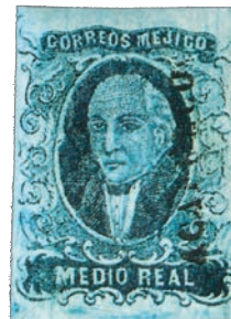
Des timbres émis en 1856 représentant Hidalgo.

C'est sur le tard que les Mexicains procèdent à leur première émission de timbres, nous sommes en 1856. Pourtant cela faisait un moment que le courrier en partance pour l'étranger était traité par les postes britanniques. L'ouverture du bureau de Veracruz date en effet de 1825 mais il ne dispose d'aucun cachet. Un bureau similaire est ouvert en 1842 à Tampico et des timbres anglais sont utilisés à partir de 1867. En revanche, ils n'auraient jamais été adressés à Veracruz. Sur les lettres de Tampico, on trouve des affranchissements mixtes avec des timbres locaux. Les deux agences britanniques fermeront en 1874 pour Vera-Cruz et 1876 pour Tampico. Le 1 er août 1856 sont donc émises cinq valeurs (1/2, 1, 2, 4 et 8 r), imprimées en feuilles de 60. Elles sont à l'effigie de Miguel Hidalgo, le héros de l'indépendance. On procéda plus tard à une seconde composition des 1 et 2r, les timbres figurant sur les feuilles étant plus rapprochés les uns des autres. A noter : de nombreuses variétés de couleurs mais