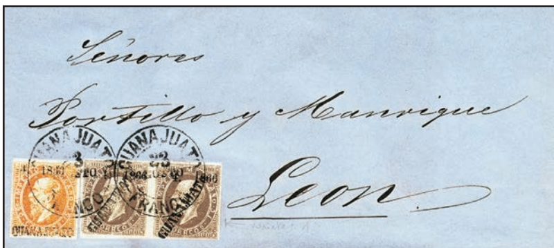
Un superbe pli affranchi de timbres à l'effigie de Maximilien archiduc d'Autriche, puis empereur du Mexique installé par Napoléon III. Ils remplacent en 1866 ceux à l'effigie d'Hidalgo. Ces timbres sur lettre sont estimés à 4 200 € pour le 7 c et 228 € pour le 25 c chez Yvert & Tellier.

aussi des timbres coupés lesquels étaient utilisés pour la moitié de leur valeur faciale. Autre particularité, les timbres imprimés entre 1856 et 1883 comportaient en surimpression le nom du district. En 1864, on ajoute à la surcharge du nom du district la date et le numéro d'envoi. La plupart des bureaux adressaient des timbres dans des localités relevant de leur autorité et faisaient figurer des chiffres correspondants au numéro de leur facture ! Ce système bien compliqué s'arrête officiellement en 1882 mais certains irréductibles districts firent durer le plaisir jusqu'en 1886.