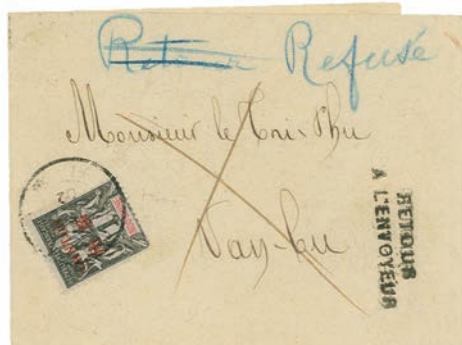
Une lettre affranchie du 1 c qui a été refusée par le destinataire et retournée à l'expéditeur. Bien que les timbres oblitérés du 1 c Groupe soient parmi les moins chers du catalogue, lorsqu'ils figurent seuls sur un pli ou du papier d'emballage ils sont parmi les plus rares des type Groupe oblitérés. Ils sont largement sous estimés par les catalogues. Parmi les 2 400 plis de la collection de type Groupe d'Edward Grabowski seulement 3 sont affranchis avec ce timbre.