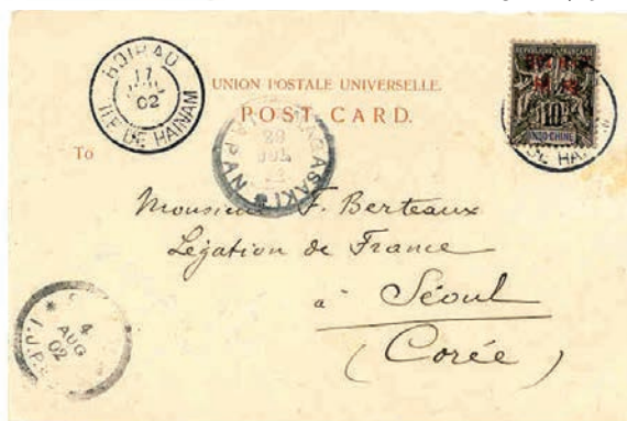
Une carte postale postée en 1902 de Hoï-Hao pour Seoul en Corée via Nagasaki (Japon).