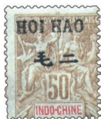
Emission de 1904. Timbres d'Indochine surchargés en cents : 50 c.