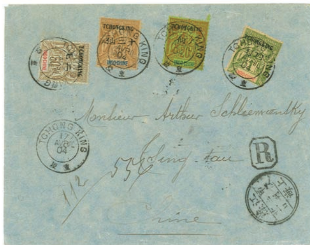
Lettre recommandée à destination de Tsingtau (7 e échelon de poids)

Emission de 1906. Timbres d'Indochine au type Groupe surchargés en cents et piastres : 75 c et 5 f.