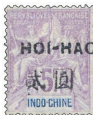
Emission de 1906. Timbres au type Groupe d'Indochine surchargés en cents et piastres : 75 c et 5f.