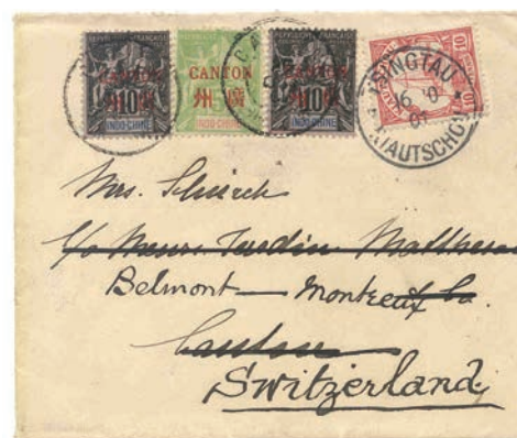
Une lettre postée du bureau allemand de Tsingtau pour Canton affranchie avec un timbre colonial allemand à 10 pfennig payant le port local. Le destinataire étant en Suisse, on a ensuite utilisé à Canton un 25 c type Groupe payant l'international. Il s'agit d'un rare exemple d'affranchissement mixte.