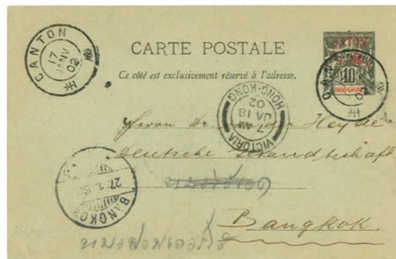
Le 10 c surchargé sur cette carte postale postée de Canton et à destination de Bangkok via Hong Kong.