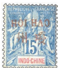
Emission de 1901. Timbres au type Groupe d'Indochine avec surcharge bilingue : 1, 2, 4, 5, 10, 15, 20, 25, 30, 40, 50, 75 c et 1 et 5 f.

Ce bureau indochinois a été créé en mai 1900 pour être fermé en décembre 1922.