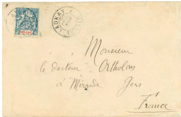
Une lettre de Mong-Tzeu oblitérée du 20 février 1900 et utilisant le rare cachet à date provisoire « LOKAY A TONKIN ». Le tarif à 15 c correspond à celui en vigueur pour la communauté française.