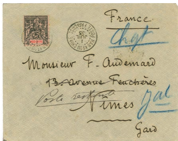
Les type Groupe surchargés pour ce bureau français n'étaient pas prévus et les lettres oblitérées de ce bureau et affranchies de Groupe se rencontrent de temps à autre. Cette lettre date de 1903 et utilise un type 25 c Groupe surchargé « Chine ».