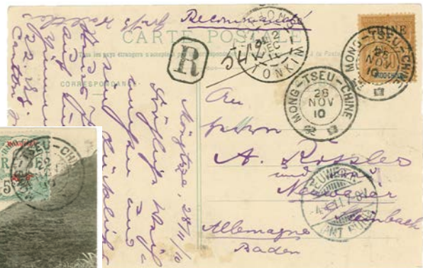
Carte postale pour l'Allemagne adressée en recommandé au tarif de 35 c (25 c pour le recommandé) avec le cachet à date « MONG-TSEU-CHINE ».