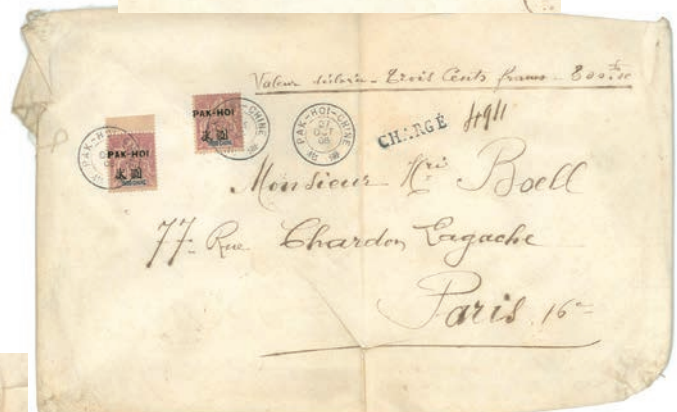
Une des plus rares enveloppes avec des type Groupe ! Adressée en valeur déclarée et affranchie au tarif de 10 f, elle est à destination de Paris. Cette lettre est en fait un sac en tissu contenant 547,60 gr de pièces de monnaie d'une valeur de 300 f. Cela correspond au 37 e échelon de poids.